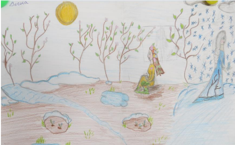
С. Никитин «Зимняя ночь в деревне»