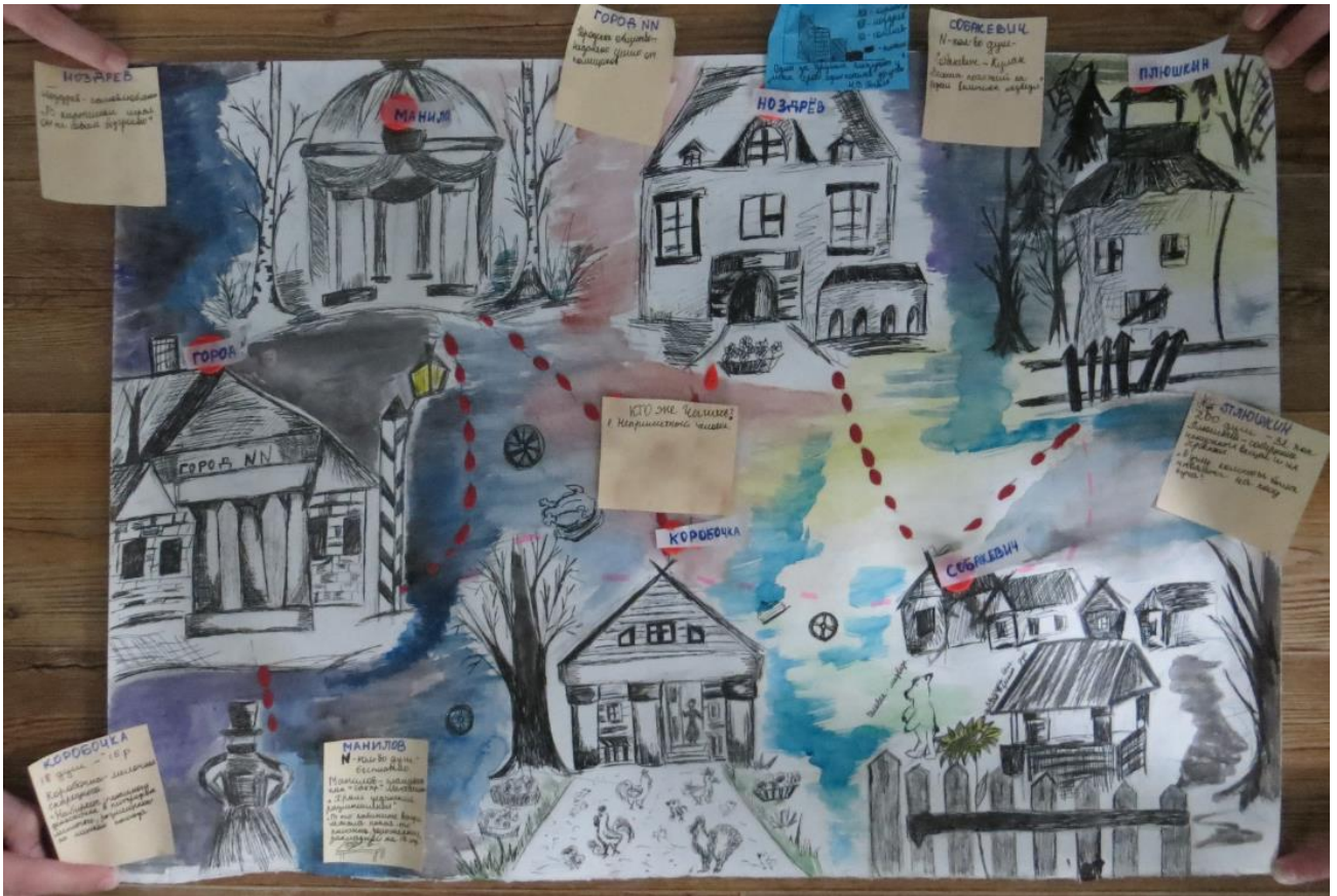
Некоторые дети представляют событийные карты в форме комиксов: